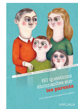
60 questions étonnantes sur les parents