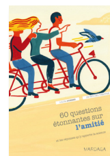
60 questions étonnantes sur l'amitié