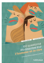
60 questions étonnantes sur l'humour et le rire