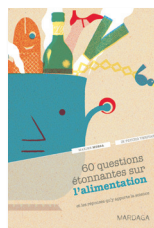
60 questions étonnantes sur l'alimentation