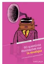
60 questions étonnantes sur la musique