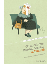
60 questions étonnantes sur la beauté